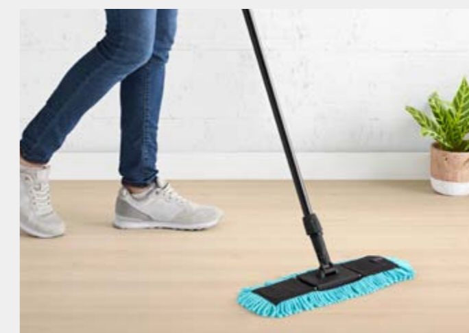
EVER017 (40 CM) EVER007 (60 CM)

EVERSEA FLAT MOP MOPA EVERSEA MOPP EVERSEA